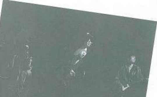
▲勢いが決め手、ザ・ライトニング・ロッカーズ ▲グランプリ受賞の賞状を手にするザ・ライトニング・ロッカーズ