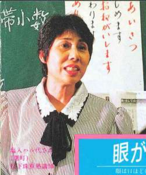
婦人から代々の （福岡） 地下鉄教務員

教えることはよく言われることだが尋常ではない。正解を語ったところで何も伝わらないからだ。その道での経験が豊富で、成功へ導く道をいくつも知っ