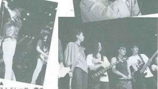
▲ベストドレッサー賞のRock'n Roll Junky