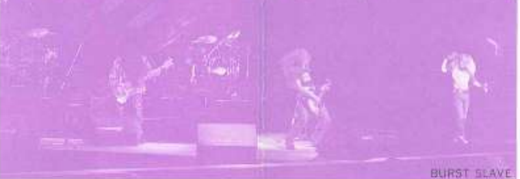
「俺達は常にはじまりでいたいんだ。始まりが終わりを意味しない様に俺達は常に歩き続けたい。混沌とした世界の中に生きている俺達の熱い気持ちを届けたい平均年齢20歳のバンド、'NEW AGE'は、そう自分たちのプロフィールに書きつけた。

この街から、立川サウンドを響かせたい。その願いを実現したいと、立川の軽音楽愛好家の有志が、ロックフェスティバル in 立川を企画したのが、平成2年。3回目の今年、名称を「ROCK WIND 100」として、いよいよ、この街の音楽を創る合図として、ピックを打った。