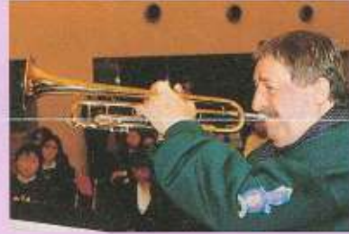
えくてびあんレポート