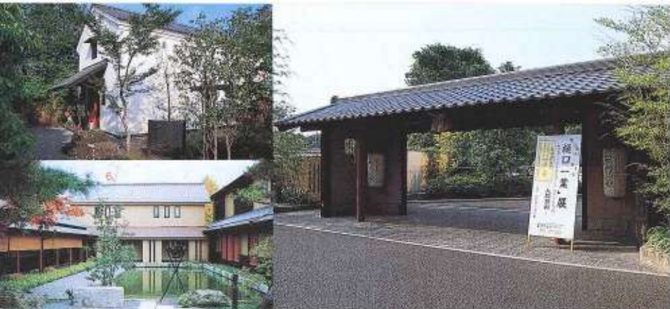
日本庭園調で落ち着いた雰囲気の中にある無門庵ギャラリー