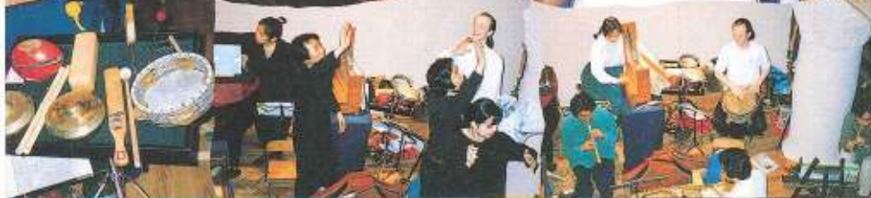
◀心踊る演技と演奏にぐんぐん引き込まれてゆく。