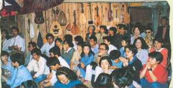
今か今かと演奏を待つファンたちは子供から大人まで。