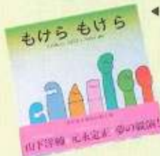
◀この絵本に描かれた絵の一つ一つが、魔法の楽譜となる。 コロポックルの家のようなライブハウスが玉川上水の駅付近に建った。