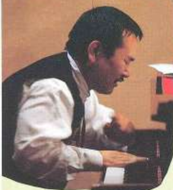
◀フリージャズ・ピアニストとして豪華な演奏でこちらに響いてくる山下洋輔さんも特別ゲストとして登場。