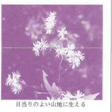
日当たりのよい山地に生える

玉川上水べりは、立川でも美しい自然の残る代表的な場所である。緑陰を求めて散策する人たちはいつもたえることがない。四季おり