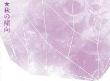
★秋の傾向 シックな傾向にあります。ジャケットは長め、スカートは短め(ロング&ショート)で、エレガントがポイント。全体的にエレガントで、やわらか素材(高島屋立川店)ブルウスにスカートにしても、カジユアルな傾向(ブティックリッチ柴崎町)配色も出ています。(北口、ふどうや本店)

「ビジュウ」ってご存じですか? フランス語で宝石という意味ですが、日本流行色協会に問い合わせたところ、これが秋色のテーマだと教えてくれた。宝石のルビー、ガーネットのような深みのある赤やサファイヤに見られるグリーン。このベイスカラーにグレイ系がひきたち互いに魅力的に見えるのがポイントとか。