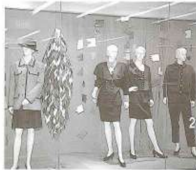
★身近にするには シンプルでもおしゃれ、コンサマータイプと言いますが、奇をてらったものでなくてもよい地味なおしゃれ。部分をちよつと変えるだけでよい。だから、小物、雑貨なんか、いいと思います。(高島屋)

★おしやれは、自分も変えられる? いつもと同じものを着ていたんじや、おしやれじゃない。いつもと違うものを着ることで、視線を感じて、背筋が伸びたり、言葉遣いが変わったり、それをすることで内面から変わっていく。秋という季節は今まではない、自分を見つけていける、時なのかもしれません。