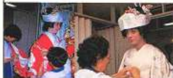
見ると着るとじゃ、大ちがい。まあなんと手間どる着物の着つけ、カツらは重いし。