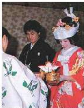
婿(佐藤雅人君)が一人にヨメ4人、変則ながら巖かな一瞬に、メリケン娘もちょっぴり緊張ぎみ。