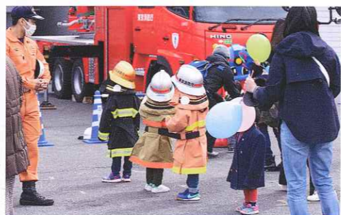
3月4日 立川消防フェスタ2017にて