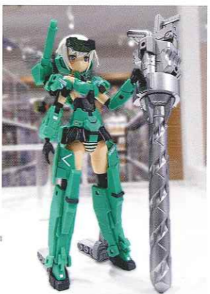
コトブキヤオリジナルプラモデル フレームアームズ・ガール

ある朝、女子高生の元に謎の小包が届きます。小包を開けると、中には『フレームアームズ・ガール』と呼ばれる完全自律型の小型ロボット「轟雷」が。通常の人工知能以上に高度な、人格を有する人工自我、AS(アーティフィシャル・セルフ)を搭載した最新型の試作機——こうして始まるアニメ『フレームアームズ・ガール』は、立川に本社があるホビーマーカー(株)壽屋の大ヒットプラモデル『フレームアームズ・ガール』をTVアニメ化したものです。4月4日(火)よりBS11・TOKYO MX・AT-Xにて放送開始です。小型ロボットがなんだかまったく知識のない少女と、だんだんに感情を備えていくロボットたちの奇妙で楽しい、ほのぼの系アニメ。背景には「あれ、ここ見たことある」というお店や場所がてんこ盛り。やっぱりサブカルの聖地立川です!