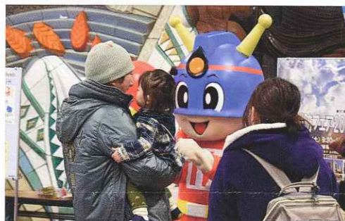
2月22日 JR立川駅コンコースにて キュータくん頭張りました

年が明けてから火事が多いと思われている方もいらっしゃるのではないのでしょうか。春とは名のみでまだ寒い時期、同時に春の大風が吹く時期でもあります。火災の一番の原因は煙草の不始末。片づけが行き届かず燃えやすいものが積みあがっていると煙草の火があれば、それは火事になってしまいます。家の中はきれいに整理整頓、火の始末はしっかりと、地震の備えも忘れず！お互いさま、気をつけていきましょう。写真は立川消防署が行った注意喚起の運動です。立川の消防フェアは毎年大規模に行われています。今年はお天気も良かったせいか、小さいお子さん連れのご家族や若い来場者が多く、とても賑やかでした。