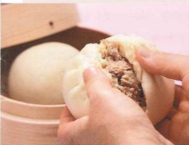
特製肉まん(奥)とあんまん(手前)

立川駅南口から徒歩5分。小さいお店に女性がふたり。中国語でお話されています。お店の奥をのぞくと、大きな蒸籠から湯気がシューシュー。オーソドックスに国産豚100%の「特製肉まん」、素朴なおいしさの「あんまん」、高菜がいっぱい「うま辛まん」、おしゃれな味の「肉野菜まん」、種類はこれだけです。でも、「これだけ」がすごくいい。「これだけ」なのに毎日食べたい、また食べたい。金包堂の中華まんは、何がおいしいって、もちろん