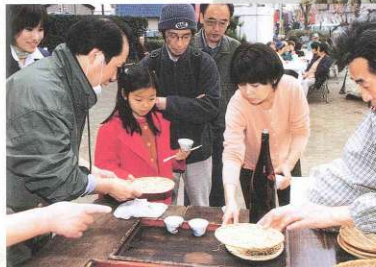
蕎麦は時間を置かずにするのが美味しく食す秘訣。試食に集まった人たちは、名人それぞれの蕎麦の味を食べ比べた。