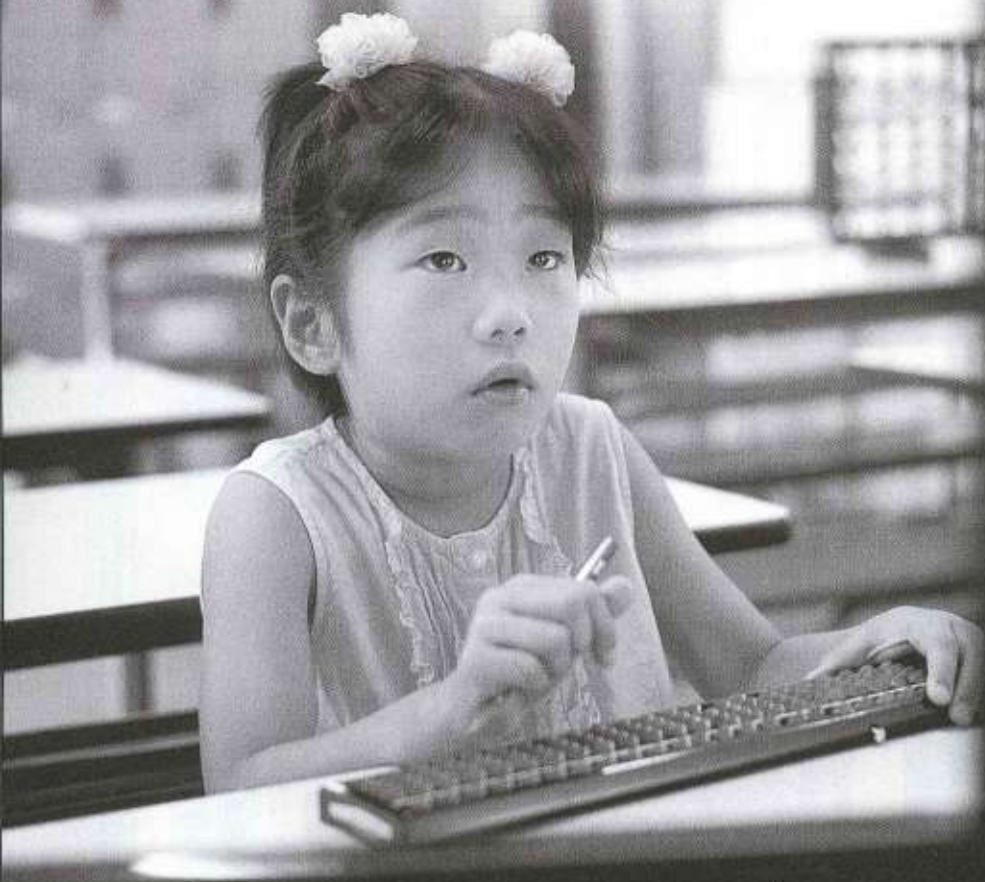
表紙の人 / 鳥潟真実 (西砂町)

7 金川佳美子 岩間佳きよ JULY 2001 JKE TEERIAN Vol.117 No.204