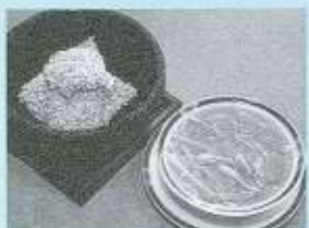
石鍋入りフカヒレのおこげ(写真) 1,480円 芝エビの特製チリソース 980円 揚げ麵 780円 絶品杏仁豆腐 300円

サンフジの料理に使用されている油はすべて植物性。動物性の油とは違い、菜種やオリーブ等の植物性油は血管壁にコレステロールが溜まりにくく、身体にやさしいのだそう。また、スープは鶏ガラしか使用しない。その分、コクがないと思われる向きもあるが、このあっさりした味付けが年輩のお客さんに特に支持されている。「この店は、美容と健康をテーマとしているが、美容も健康も精神的な安定の上に成り立つもの。安心感のあるサービスを心がけたい」というのが、小山さんの信念。この強い思いが従業員にも波及し、来店のお客さまに喜んでもらうべく、日々、気持ちの込められた親しみのあるサービスが提供されている。